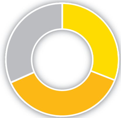
Wärmequellen aller Gebäude in Therwil