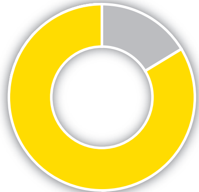
Strassen im Gemeindegebiet